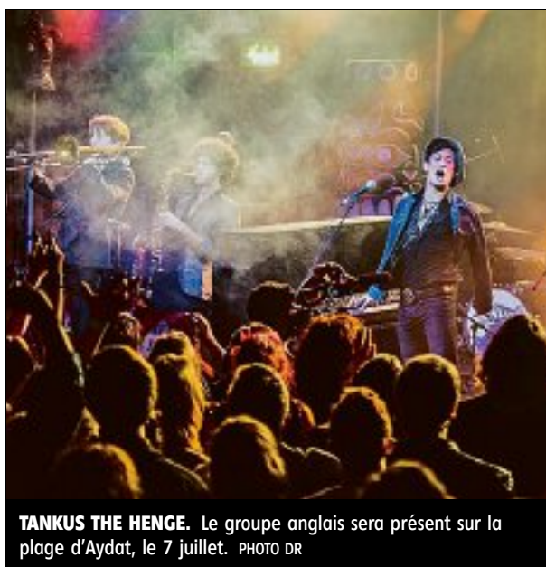
TANKUS THE HENGE. Le groupe anglais sera présent sur la plage d'Aydat, le 7 juillet.